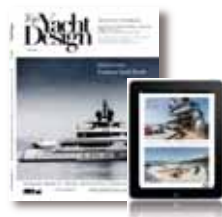
Top Yacht Design