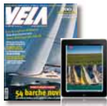
Giornale della Vela